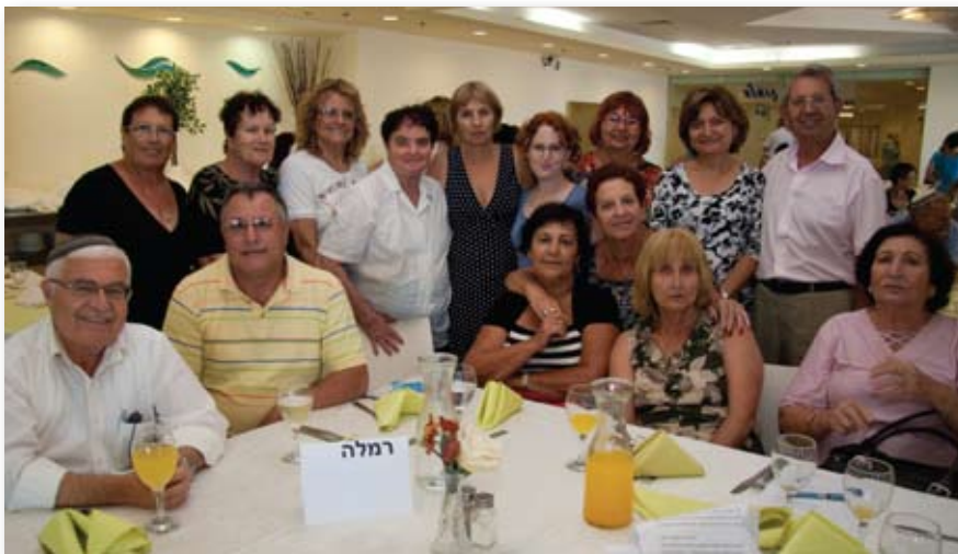
קבוצת המתנדבים סניף רמלה