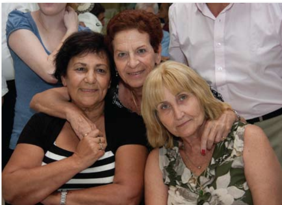
מתנדבות מסניף רמלה