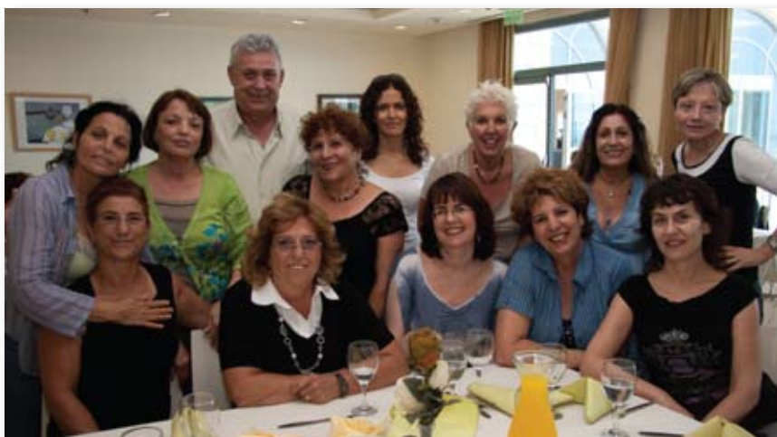
קבוצת המתנדבים בסניף ראשל"צ