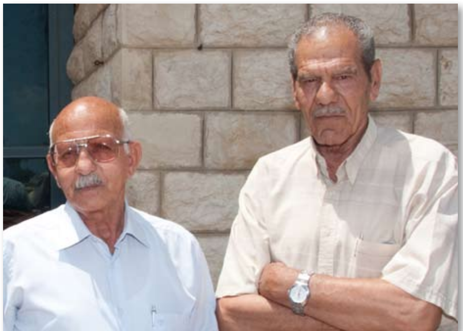
מתנדבים בסניף נצרת