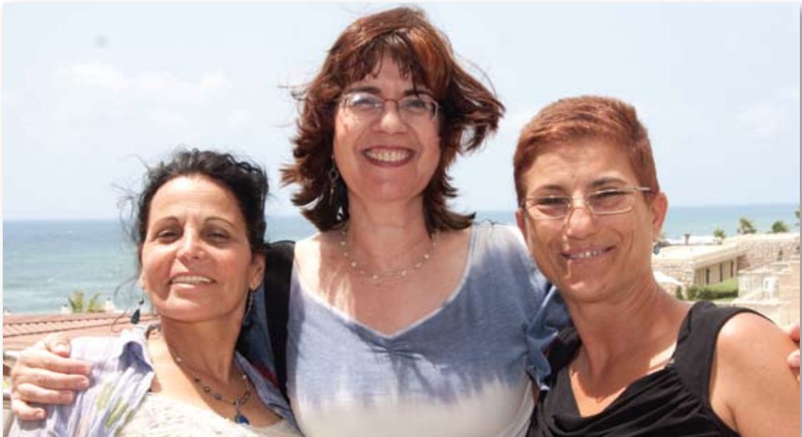
קבוצת המתנדבים בסניף ראשל"צ

” אילו היינו יכולים לראות את עושרו של אור המתגלה בכל פעם שאנחנו נותנים מעצמנו, היינו רצים כל היום בחיפוש אחר הזדמנויות לנתינה”