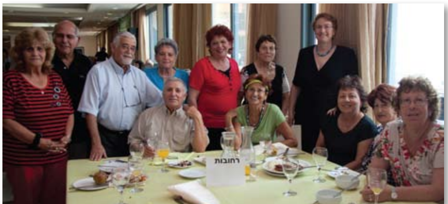
קבוצת המתנדבים בסניף רחובות