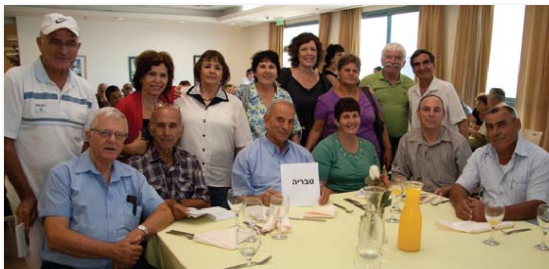
קבוצת המתנדבים בסניף טבריה