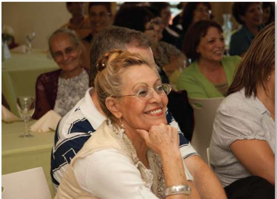
מתנדבת בסניף חדרה