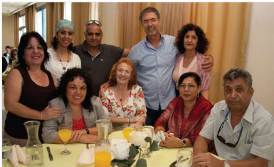
קבוצת המתנדבים בסניף אשקלון