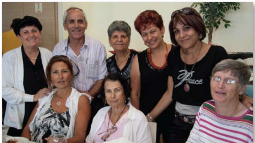
קבוצת המתנדבים בסניף באר שבע