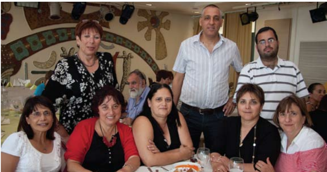
קבוצת המתנדבים בסניף ירושלים