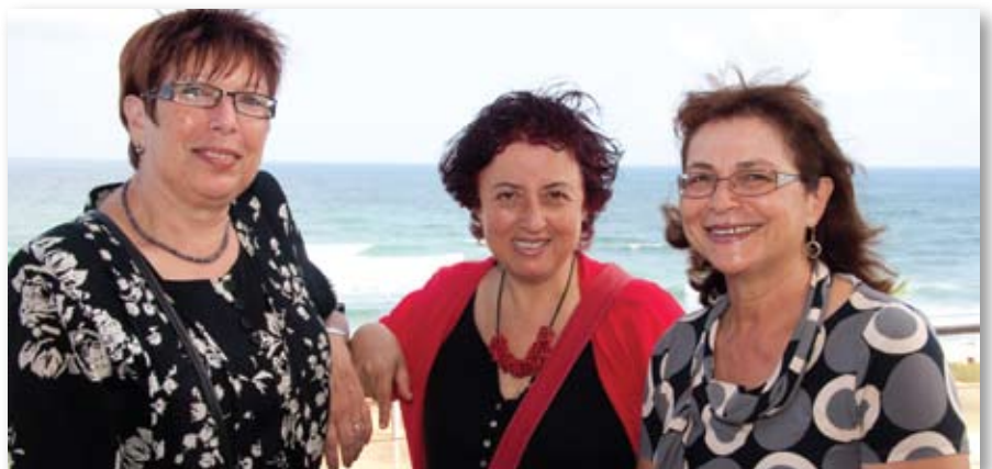
מתנדבות בסניף ירושלים