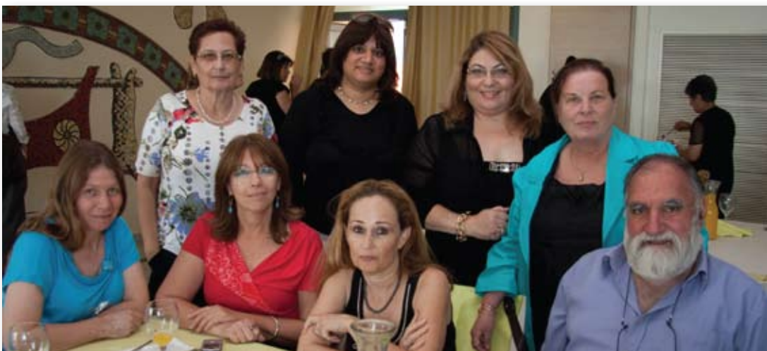
קבוצת המתנדבים בסניף פתח תקוה