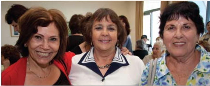
מתנדבות מסניף טבריה

” התנדבות פירושה לבחור לפעול מתוך הכרה בצורך קיים, ומתוך גישה של אחריות חברתית, וזאת ללא ציפיה לתגמול כלכלי. עשייה שהיא מעבר לחובותיו הבסיסיות של אדם